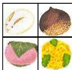
開発商品 (4種1セット、200円で販売)