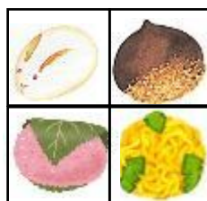
開発商品（4種1セット、200円で販売）