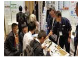
ペーパークラフト