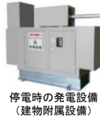
停電時の発電設備 (建物附属設備)