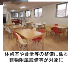
休憩室や食堂等の整備に係る 建物附属設備等が対象に