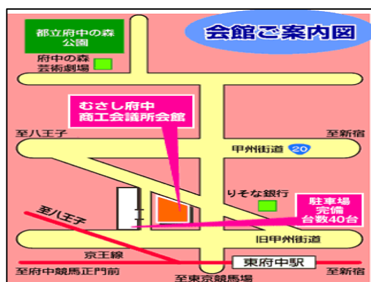
京王線「東府中駅」北口より徒歩1分