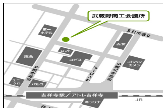
JR「吉祥寺駅」北口より徒歩5分